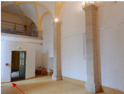
Entrée de la chapelle