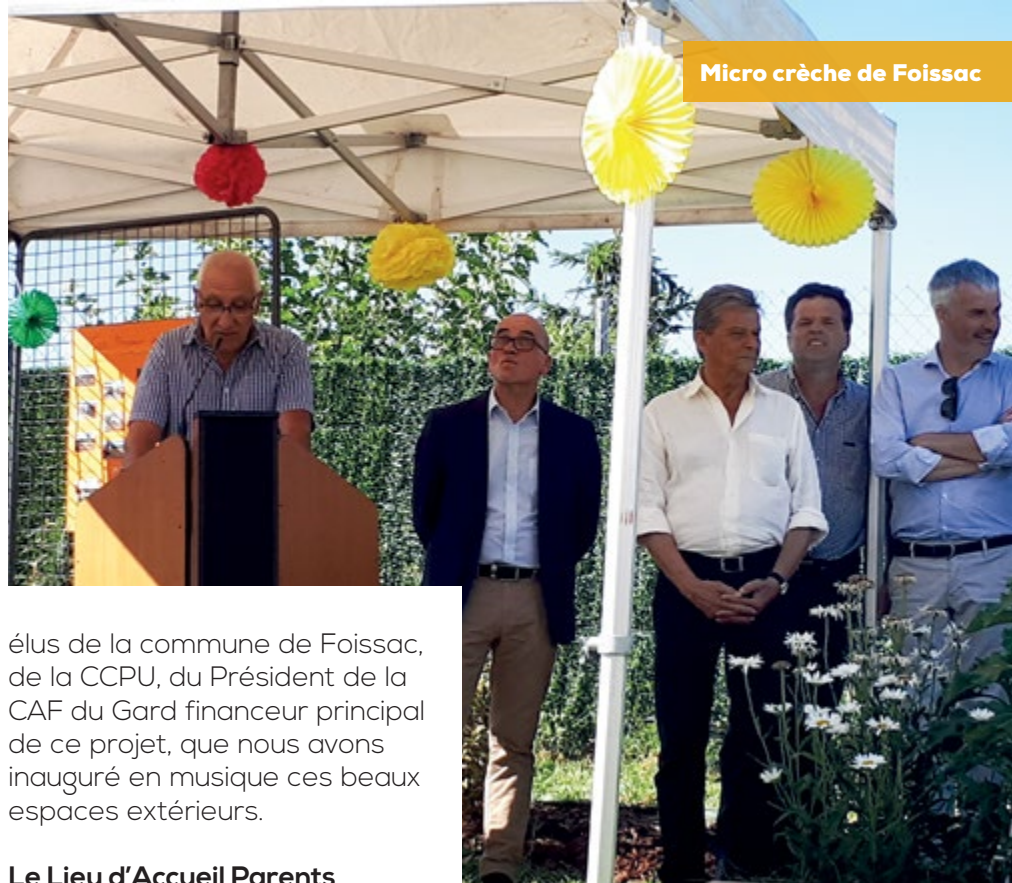
Micro crèche de Foissac

Vice-Président en charge de l'enfance-jeunesse