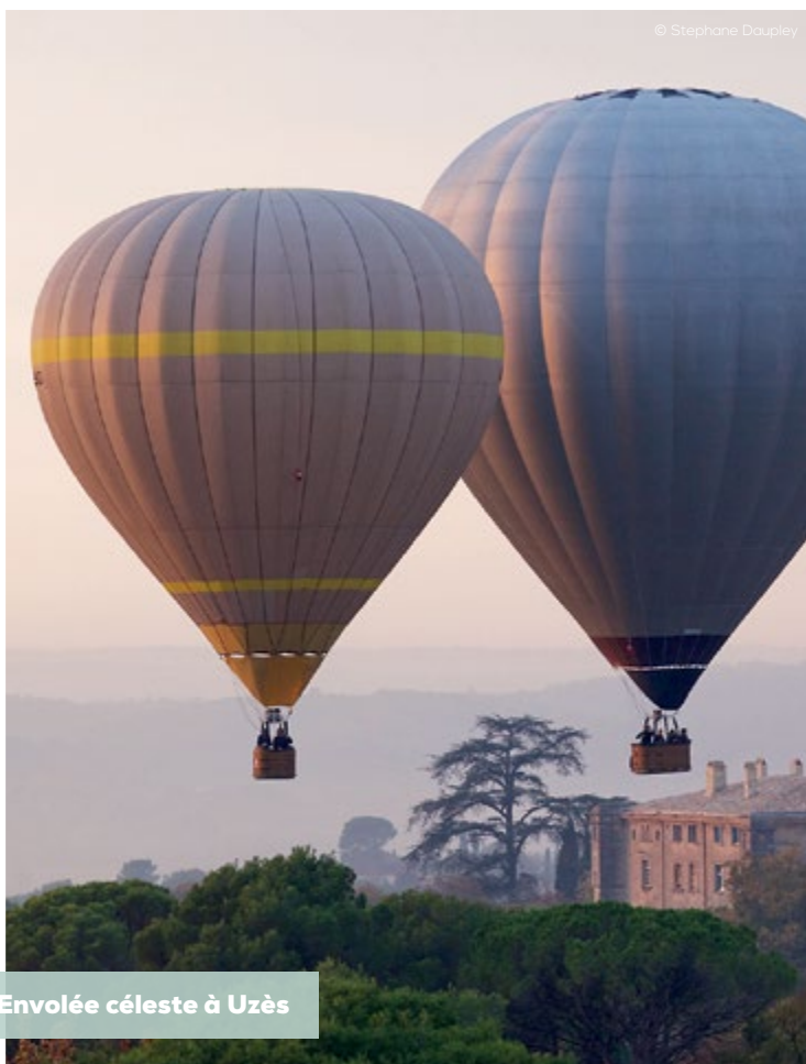
Envolée céleste à Uzès