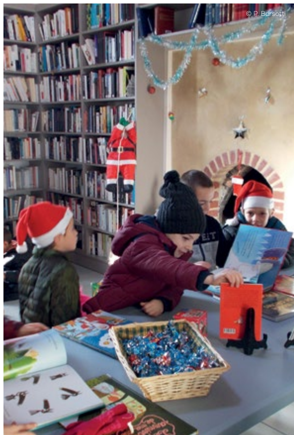
Noël des enfants à la bibliothèque de la Bastide d'Engras