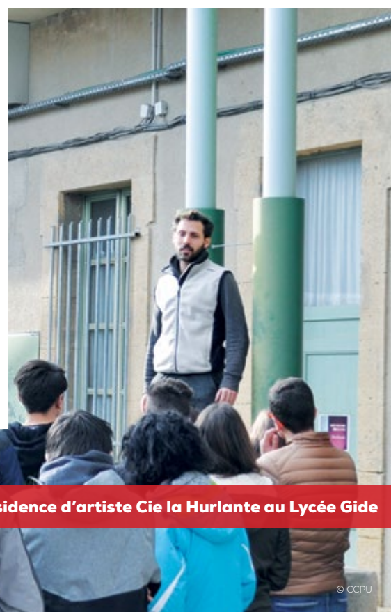
Résidence d'artiste Cie la Hurlante au Lycée Gide

la compagnie la Hurlante qui reviendra début mars (présentation du spectacle lors du Temps des Cerises). Au collège Lou Redounet, c'est la compagnie de cirque « Vol à l'étalage », qui a pris ses quartiers ce mois-ci et ce, pour 5 semaines avec une restitution publique le 27 avril prochain, lors du lancement de la saison #15 du Temps des Cerises et de l'évènement « Sur un Trapèze ». Enfin, Grumo et Supocaos seront de retour en terre uzétienne, au lycée Guynemer pour une résidence de trois semaines.