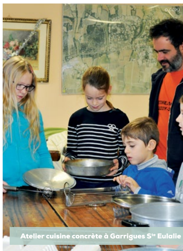
Atelier cuisine concrète à Garrigues S te Eulalie