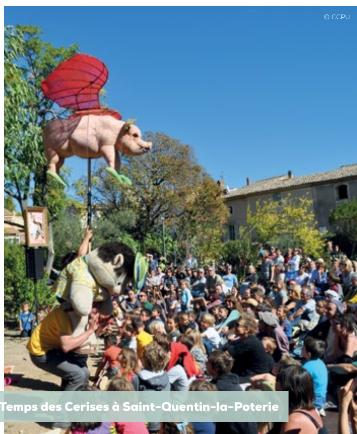
Temps des Cerises à Saint-Quentin-la-Poterie