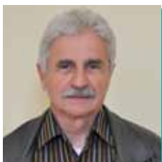
Pierre MICHEL 13 ème Vice-président : Délégation en matière de politique de l'emploi