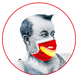
MASQUES JETABLES à disposition Port du masque conseillé