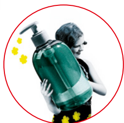
GEL HYDROALCOOLIQUE à disposition

POUR CONTINUER À VOUS FAIRE VIVRE ET PARTAGER CES INSTANTS DE JOIE, DE RENCONTRES ET DE DÉCOUVERTES ARTISTIQUES EN TOUTE SÉCURITÉ, LA COMMUNAUTÉ DE COMMUNES PAYS D'UZÈS MET EN PLACE DES MESURES DANS LE RESPECT DES PROTOCOLES SANITAIRES EN VIGUEUR.