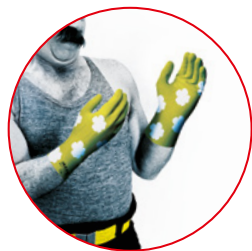
NETTOYAGE ET DÉSINFECTION de l'espace public (tables, chaises...)